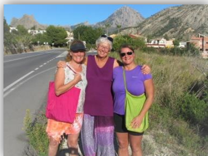
Med goa vänner på promenad...